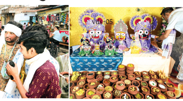
विदिशा। रथयात्रा में शामिल भगवान का विग्रह।

मंगलसूत्र चोरी की शिकायतें भी सामने आईं। भगवान जगदीश स्वामी का भव्य स्वागत मंदिर परिसर में किया गया। विद्वान पंडितों द्वारा