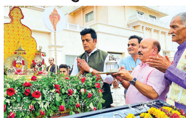
रिसोर्ट में अपनी भजनों की प्रस्तुति दे कर सभी को मंत्र मुग्ध कर दिया। विख्यात फिल्म अभिनेता और सांसद रविकिशन भी रथयात्रा में सम्मिलित हुए। पूजा अर्चना आरती के बाद उन्होंने रथ को भी खींचा।

27 जून को यूटोपिया होटल में पहली बार शनिवार की शाम 6 बजे महाप्रभु जगन्नाथ की रथयात्रा निकाली गई। महाप्रभु जगन्नाथ, ज्येष्ठ बलभद्र और बहन सुभद्रा के साथ रथ पर आरूढ़ होकर यूटोपिया रिसोर्ट से निकले और सांची नगर का भ्रमण कर वापस यूटोपिया लौटे। सांची नगर में रथ का जगह-जगह स्वागत किया गया और महाप्रभु की आरती हुई।