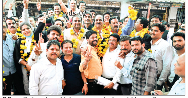
विदिशा। निर्वाचन संपन्न होने के बाद एक दूसरे को बधाई देते हुए अभिभाषकगण।