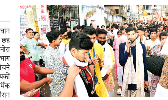
विदिशा। नगर में भक्तिवेदांत गुरुकुल रथयात्रा में नाचते भक्तगण।

27 जून को विशाल रथ यात्रा के साथ भगवान जगदीश स्वामी शनिवार को शाम पांच से छह बजे के बीच जनकपुरी से अपने धाम मानोरा लौटे। लाखों श्रद्धालुओं ने रथ यात्रा में भाग लेकर भगवान के दर्शन किए। रथ को खींचने का सौभाग्य भक्तों ने प्राप्त किया। विधायकों और अन्य जनप्रतिनिधियों ने भी इस धार्मिक आयोजन में भाग लिया। रथ यात्रा के दौरान जगह-जगह समाजसेवियों ने लंगर एवं पानी की व्यवस्था की। सुरक्षा के पुख्ता इंतजाम किए गए थे, जहां पुलिस बल एवं सीसीटीवी कैमरों की सहायता से भीड़ पर नजर रखी गई। भीड़ के दौरान कुछ घटनाएं जैसे पर्स और